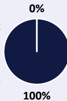
2. Su taksonomija suderintos investicijos, išskyrus valstybės obligacijas*