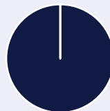
2. Su taksonomija suderintos investicijos, išskyrus valstybės obligacijas*

■ Su taksonomija suderintos: iškast. dujos